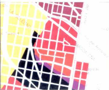
PLANO DE URBANIZACIONES

La circunstancia de no quedar sobre vías arterias oriente-occidente, pudo haber sido la causa de su excepcional conservación. Las áreas verdes de antejardines y calles ofrecen, junto con la escala de sus viviendas de dos pisos un panorama urbano singular.